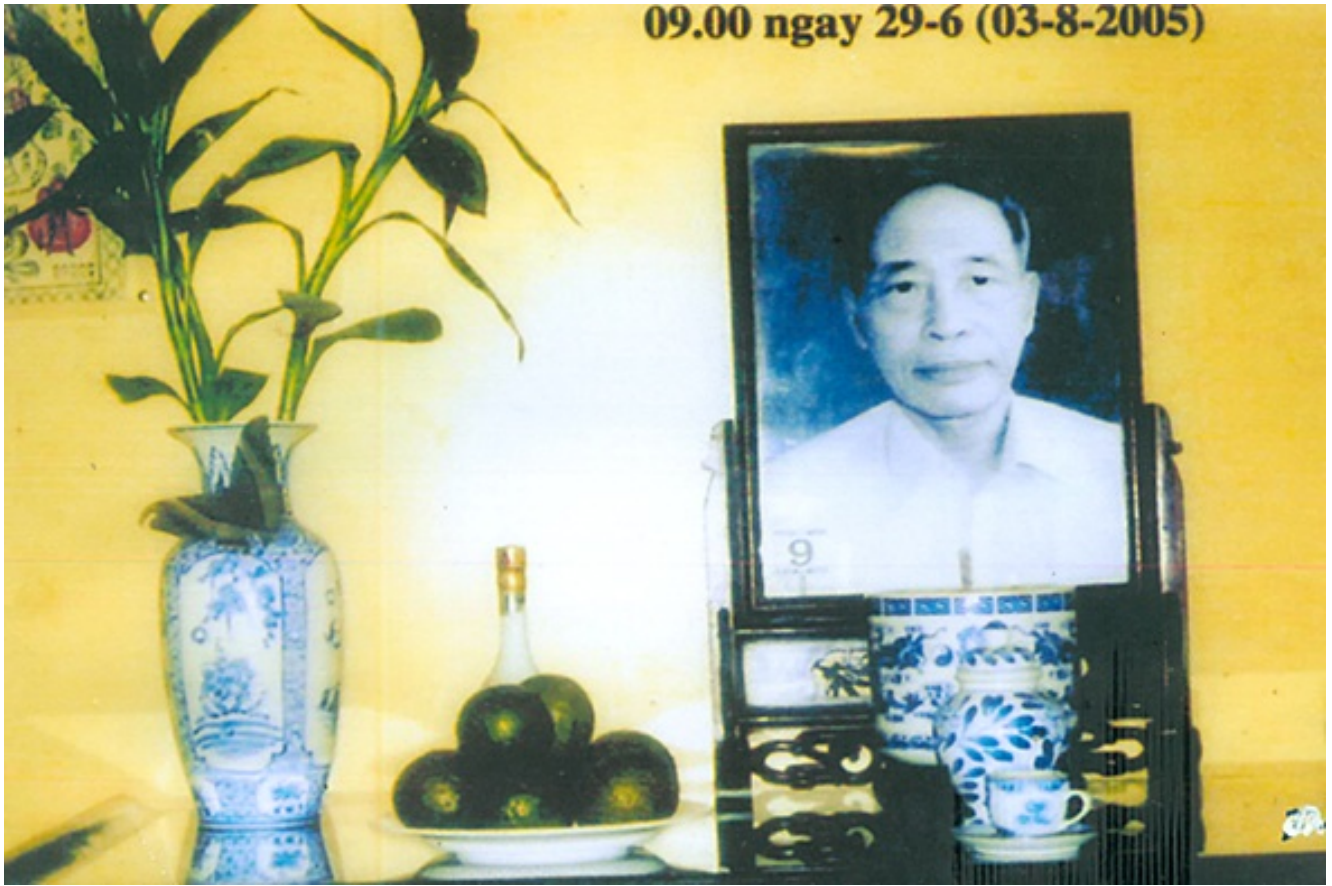
Bướm bay về đậu bàn thờ tướng Trần Độ