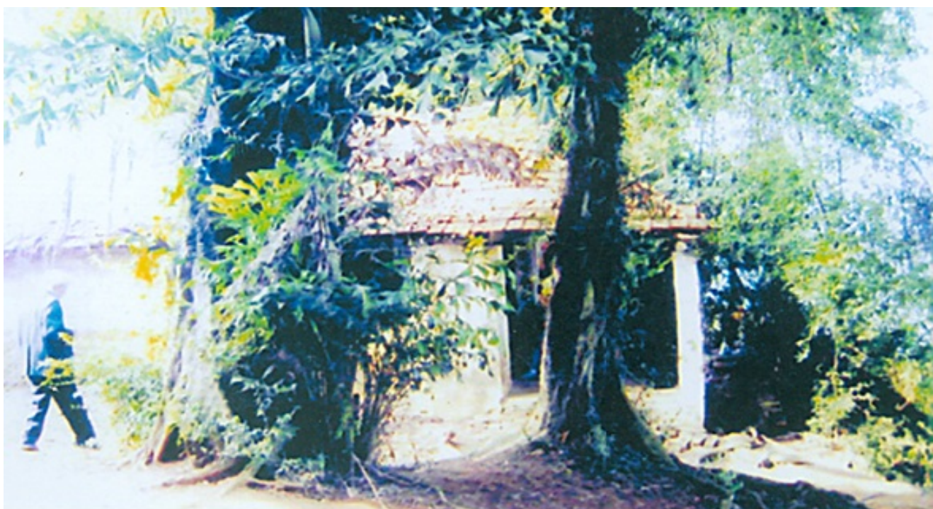
Đền thờ nữ đại tướng Bát Nàn ở Việt Trì, tỉnh Phú Thọ (Trước khi trùng tu)

Một thời gian sau, theo đề nghị của địa phương, cấp trên cho một phần kinh phí, nhân dân đóng góp một phần để trùng tu. Thế là nảy sinh ra hai loại ý kiến, không thể khởi công được. Một bên là giao cho các nhà thầu. Một bên là các cụ hội người cao tuổi sợ tiền ít mà thất thoát tiêu cực thì không xong, nên các cụ muốn được trực tiếp nhận trách nhiệm trùng tu. Trong khi đang tranh cãi, một con rắn trắng xuất hiện nằm tại đền, mưa nắng, ngày đêm không đi đâu. Dân làng nấu xôi, gà ra cúng, lấy ô ra che mưa che nắng... Cả chủ thầu và toán thợ sợ quá bỏ đi. Sau đó, được chính quyền giúp đỡ, các cụ hội người cao tuổi đảm nhiệm - rắn đi. Chúng tôi lại đến khảo sát, miếu thờ đã được xây dựng khang trang, có tiền sảnh, minh đường rất đẹp. Thỉnh thoảng rắn vẫn đi qua cửa đền.